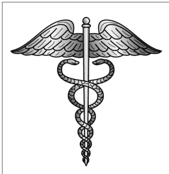
Figura 1. Caduceo de Ermes o Mercurio. En: http://es.wikipedia.org/wiki/Caduceo ; consultado 25/1/2013.

Según la fábula de Ovidio, en la Mitología Griega, el caduceo fue regalado por Apolo a Mercurio para terminar una disputa entre ellos; Mercurio había regalado al Dios de la Música la lira de siete cuerdas. Según se dice, Mercurio encontró en el Monte Citerón a dos serpientes que se peleaban, él